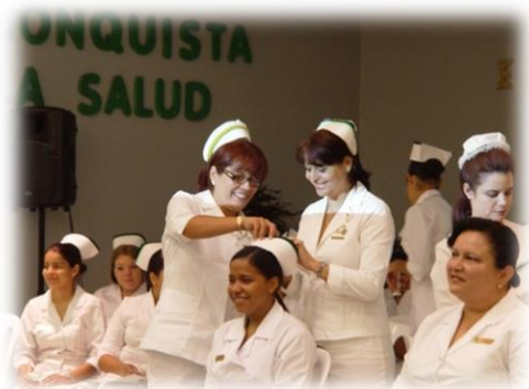
Ceremonia del Capping

LOS GRADUADOS SON RESPONSABLES DE SU DESARROLLO CONTINUO PROFESIONAL Y PERSONAL Y ESTÁN ALERTAS A LOS CAMBIOS DINÁMICOS Y TENDENCIAS EN LA PRÁCTICA DE ENFERMERÍA PROFESIONAL. SON CIUDADANOS RESPONSABLES, RESPETUOSOS Y HONORABLES EN SU COMPROMISO HACIA LA PROFESIÓN Y LA SOCIEDAD. ESTOS POSEEN LOS REQUISITOS MÍNIMOS NECESARIOS PARA SOLICITAR EL EXAMEN DE REVÁLIDA DE LA JUNTA EXAMINADORA DE ENFERMERÍA DE PUERTO RICO.