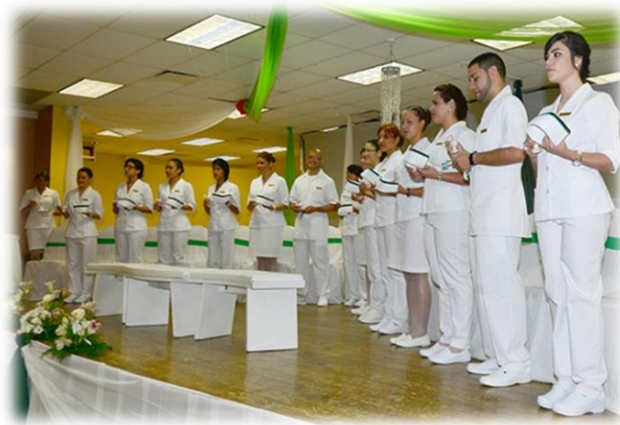
CLASE GRADUANDA 2014